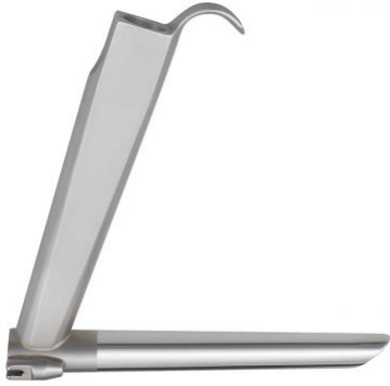
fig. 6; Ø 13x18mm; 182mm